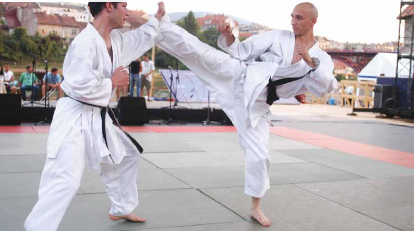
Prikaz borilnih veščin