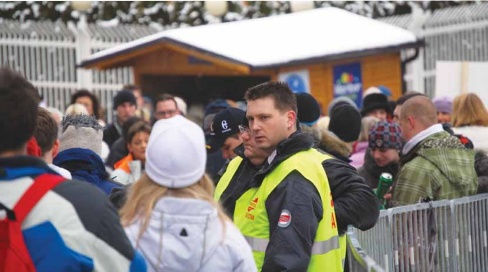
Varovanje Zlate Lisice