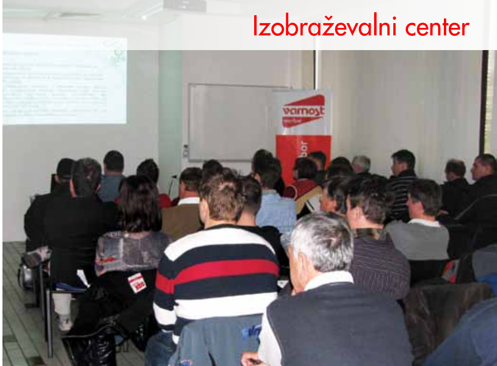
Izobraževanje v našem izobraževalnem centru

V Nogometni zvezi Slovenije (NZS) je sistem izobraževanj na vseh področjih delovanja izjemno dobro načrtovan in tudi sistematično izveden. V posameznih segmentih se usposabljanja izvajajo na ravni Evropske nogometne zveze (UEFA), nekateri programi pa so prepuščeni nacionalnim nogometnim zvezam.