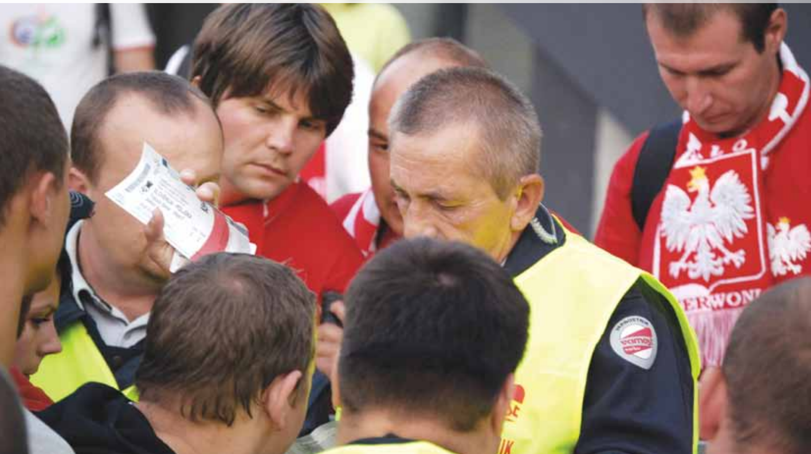
Na nogometni tekmi