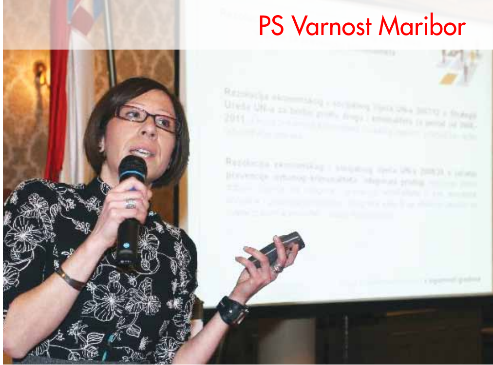
Predavanje na konferenci SIGG 2010

Konferenca je namenjena lokalnim (samo) upravnim skupnostim ter gospodarskim subjektom, ki imajo interes za zagotavljanje varnostnih storitev na vseh ravneh. Namen konference je omogočiti izmenjavo strokovnih informacij in najnovejših praktičnih izkušenj mest s Hrvaške in iz Evrope. Spoznati to, slednje, je bil tudi najmočnejši razlog za naše sodelovanje. Konferenca je bila razdeljena na nekaj tematskih sklopov: