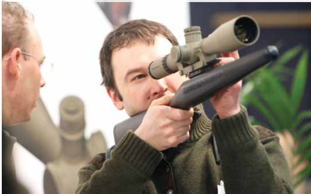
Utrinek iz sejma

Sejem IWA je eden največjih sejmov na svetu s področja strelstva, aktivnosti v naravi in osebne zaščite. Na njem razstavlja več kot 1.100 razstavljalcev iz 52 držav sveta, v štirih dneh pa ga obišče okoli 32.000 ljudi. Vsako leto drugi konec tedna v marcu poteka v Nürnbergu.